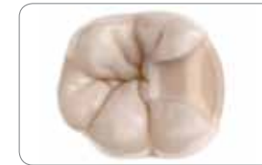
Широка кавитетна препарация

EQUIA Forte се основава на впечатлителното клинично представяне на оригиналната система EQUIA и представлява реална алтернатива за възстановяванията в дисталната област. Посредством своята глас-хибридна технология, EQUIA Forte разширява препоръчителните индикации за употреба при Class II кавитетни препарации (без туберкули).